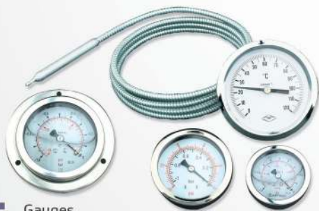
15 Gauges Calibres Medidores de pressão, vácuo, termômetros