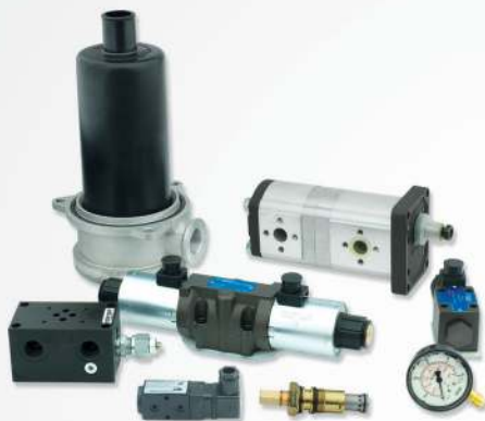
13 Hydraulic pumps Bombas hidráulicas Peças e Componentes Hidráulicos

QUALIDADE E ATENÇÃO AO MENOR DOS DETALHES SÃO OS ELEMENTOS QUE DISTINGUEM A EMPRESA, QUE DESDE SUA FUNDAÇÃO, TEM SERVIDO COM SUCESSO À INDÚSTRIA DE CURTUMES E EXPORTADO SEUS PRODUTOS PARA MAIS DE 80 PAÍSES.