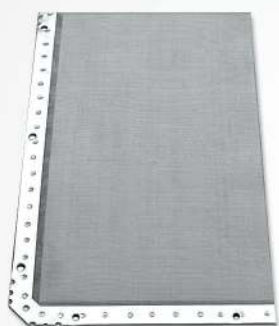
01 Fine St/Steel Wire Mesh Malla fina de acero inoxidable Malhas em aço inoxidável para qualquer secagem a vácuo

"FOUNDED AS A MANUFACTURER AND EXCLUSIVE DISTRIBUTOR OF SPARE PARTS FOR VACUUM DRYERS FOR THE TANNING INDUSTRY, SINCE 1968 OUR COMPANY HAS BEEN AN EXAMPLE OF QUALITY AND LEADERSHIP, NOT ONLY IN EUROPE, BUT THROUGHOUT THE WORLD. QUALITY AND ATTENTION TO EVEN THE SMALLEST DETAILS ARE THE ELEMENTS THAT DISTINGUISH THE COMPANY THAT SINCE ITS FOUNDATION HAS SUCCESSFULLY SERVED THE TANNING INDUSTRY AND HAS EXPORTED ITS PRODUCTS TO MORE THAN 80 DIFFERENT COUNTRIES."