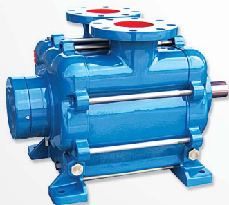
09 Vacuum pumps Bombas de vacío Bomba de vácuo com / sem motor elétrico