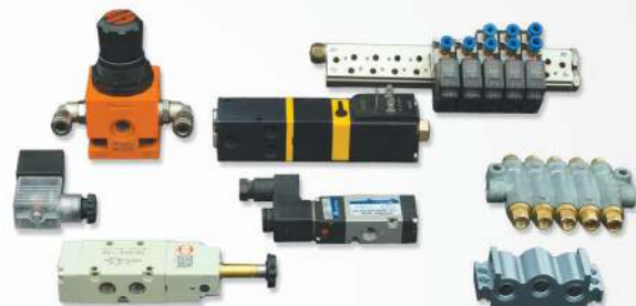
14 Pneumatic parts Piezas neumáticas Peças pneumáticas