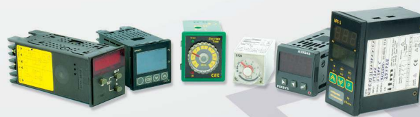
12 Timers Temporizadores Timers