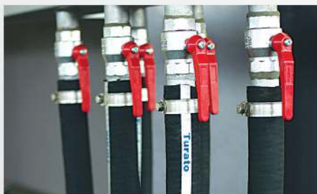
17 Rubber hoses Mangueiras de caucho Tubos de borracha por vácuo, água, óleo