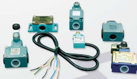
18 Limit switches Interruptores de fim de carrera Segurança e posição fim parar