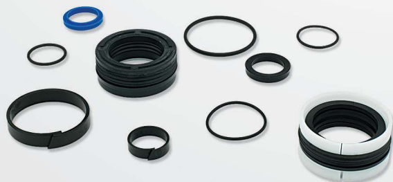
11 Gaskets & seals for any type of cylinders Juntas y sellos para cualquier tipo de cilindro Cilindro de Gaxetas para a captação de quadros e plataformas