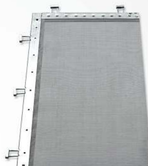
02 Fine St/Steel Wire Mesh - GOZZINI type Malla fina de acero inoxidable - tipo GOZZINI Malhas em aço inoxidável Tipo Gozzini