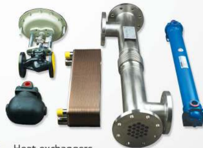
16 Heat exchangers Intercambiadores de calor Trocadores de calor