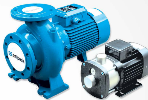
08 Oil & Water pumps Bombas de aceite y agua Água quente, água fria, óleo de recirculação da bomba