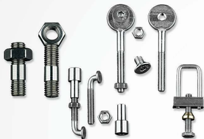
07 Bolts, Tie Rods, Screws for meshes Pernos, tirantes, tornillos para mallas Pinos e ganchos para montagem da malha em aço inoxidável

“NUESTRA EMPRESA, QUE NACIÓ COMO FABRICANTE Y DISTRIBUIDOR EXCLUSIVO DE PIEZAS DE RECAMBIO DE SECADORES AL VACÍO PARA LA INDUSTRIA DEL CURTIDO DE PIELS, ES DESDE 1968 UN EJEMPLO DE CALIDAD Y LIDERAZGO, NO SOLO EN EUROPA, SINO DE FORMA INTERNACIONAL. CALIDAD Y ATENCIÓN POR EL MÁS MÍNIMO DETALLE: ESTOS SON LOS ELEMENTOS QUE DIFERENCIAN A UNA EMPRESA QUE ESTÁ AL SERVICIO DE LA INDUSTRIA MUNDIAL DEL CURTIDO DE PIELS DESDE SU NACIMIENTO Y QUE EXPORTA SUS PRODUCTOS A MÁS DE 80 PAÍSES.”