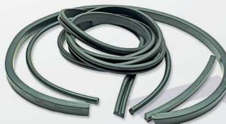
06 Rubber table stop Tope de mesa de goma Mesa de parada em borracha