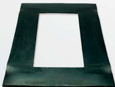
05 Rubber Seal for table closure Labios de goma/hule Perímetro fechamento da banda da mesa em borracha