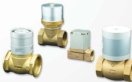
10 Vacuum & Vacuum break valves Válvulas de vacío y de corte de vacío Válvulas de vácuo e de liberação do vácuo