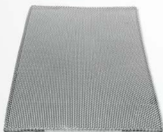
03 Double Coarsed St/Steel Wire Mesh Malla doble/gruesa de acero inoxidable Malha em aço inoxidável duplamente cruzada