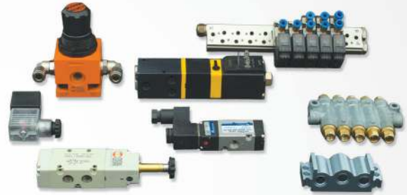
14 Pneumatic parts Pièces pneumatiques