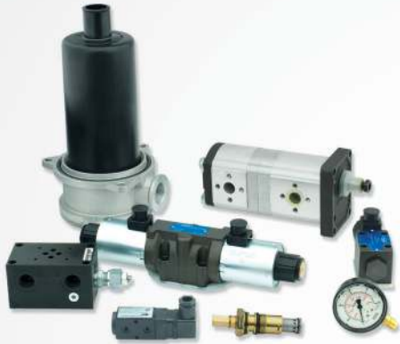
13 Hydraulic pumps Pompes hydrauliques

مصنع شركتنا في ايطاليا والذي انشئ في عام 1968 هو الرائد عالميا في مجال تصنيع و توزيع قطع غيار المجففات الهوائية لصناعات دباغة الجلود . و بتواجد قوى في السوق بفضل التخصص و الخبرة في خدمة صناعات دباغة الجلود على مر السنين في اكثر من 80 دولة حول العالم