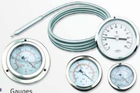
15 Gauges Jauges

عدادات للضغط و عداد للهواء و مؤشرات حرارة