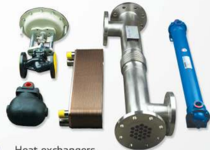
16 Heat exchangers Échangeurs de chaleur

عدادات للضغط و عداد للهواء و مؤشرات حرارة