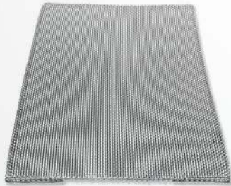
03 Double Coarsed St/Steel Wire Mesh Treillis métallique RUGUEUX en acier inoxydable شبكة مزدوجة من الاستانلس