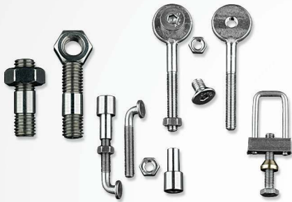
07 Bolts, Tie Rods, Screws for meshes Boulons, tirants, vis pour mailles خطاطيف من الاستانلس و قضبان للربط لتجميع الشبكة

"FONDÉE EN TANT QUE FABRICANT ET DISTRIBUTEUR EXCLUSIF DE PIÈCES DÉTACHÉES POUR SÈCHEURS SOUS VIDE POUR L'INDUSTRIE DU TANNAGE, NOTRE ENTREPRISE EST DEPUIS 1968 UN EXEMPLE DE QUALITÉ ET DE LEADERSHIP, NON SEULEMENT EN EUROPE, MAIS DANS LE MONDE ENTIER. LA QUALITÉ ET L'ATTENTION AUX MOINDRES DÉTAILS SONT LES ÉLÉMENTS QUI DISTINGUENT L'ENTREPRISE QUI, DEPUIS SA FONDATION, A SERVI AVEC SUCCÈS L'INDUSTRIE DU BRONZAGE ET A EXPORTÉ SES PRODUITS DANS PLUS DE 80 PAYS DIFFÉRENTS."