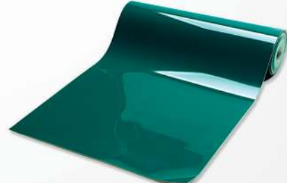
04 PVC Sealing mat PVC Tapis حصيرة من مادة PVC لجميع الموديلات و الالوان