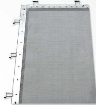
02 Fine St/Steel Wire Mesh - GOZZINI type Treillis métallique FIN en acier inoxydable GOZZINI شبكة ذات جودة من نوع جوتسيني