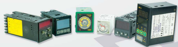
12 Timers chronométrés