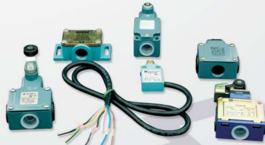
18 Limit switches Interrupteurs de fin de course