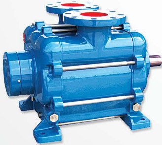
09 Vacuum pumps Pompes à vide مضخة هوائية مع او بدون موتور