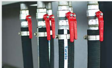
17 Rubber hoses Tuyaux en caoutchouc