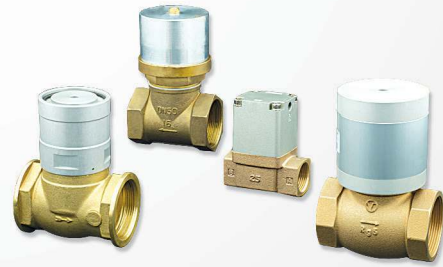
10 Vacuum & Vacuum break valves Vannes de vide et de coupure de vide صمامات لقيض و اطلاق الهواء