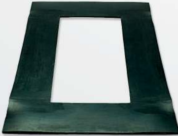
05 Rubber Seal for table closure Joint en caoutchouc pour la fermeture de la table رابط محيط من المطاط لاحكام الطاولة