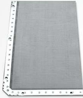
01 Fine St/Steel Wire Mesh Treillis métallique FIN en acier inoxydable شبكة ذات جودة من الاستانلس لكل مجفف هوائي

QUALITY AND ATTENTION TO EVEN THE SMALLEST DETAILS ARE THE ELEMENTS THAT DISTINGUISH THE COMPANY THAT SINCE ITS FOUNDATION HAS SUCCESSFULLY SERVED THE TANNING INDUSTRY AND HAS EXPORTED ITS PRODUCTS TO MORE THAN 80 DIFFERENT COUNTRIES."